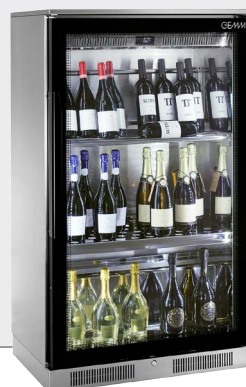
MODELE 135 54 bouteilles maximum H135 cm X L81 cm X P50 cm