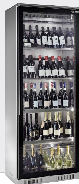
MODELE 210 102 bouteilles maximum H210 cm X L81 cm X P50 cm